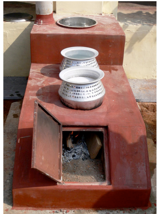
Effiziente Holzherde als Chance für Entwicklungsländer.