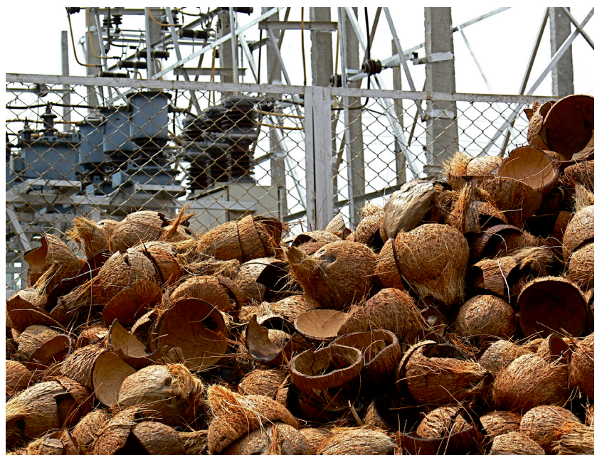
Mit der modernen Holzvergasung lässt sich aus Kokosabfällen Strom herstellen.

die Ernährungssicherheit nicht gefährdet wird, brauchen die Entwicklungs- und Schwellenländer Strategien für eine nachhaltige Bioenergienutzung.